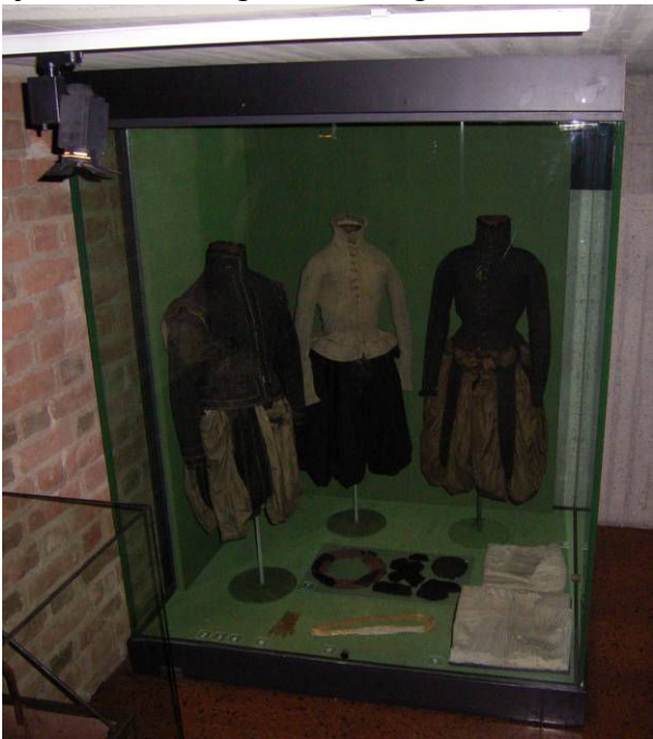
Dragter i Museet ved Uppsala Domkirke