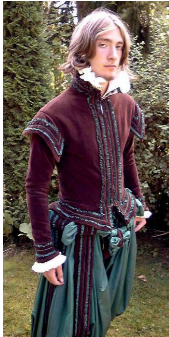
Dragt syet efter tilskæring og syteknikker brugt ved Sturedragterne.