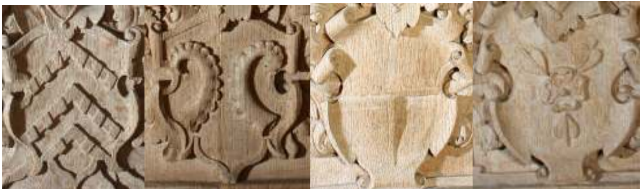
Sparre, Basse, Parsberg og Sehested våben på de meget flotte stolegavle i Toksværd kirke