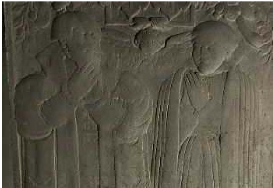
Pernille Gøje, Herlufsholm kirke