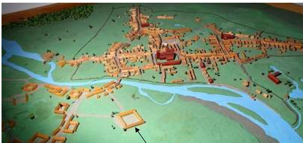
Den nye firelængede præstegård i Lille Næstved