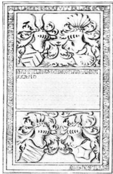
De fædrene våben Grubbe (Sparre) og Grubbe til venstre og Baden og Halvegge til højre.