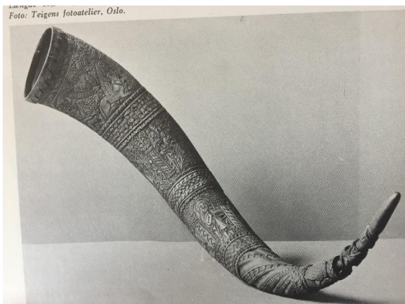
Drikkehornet – treenighedshornet.