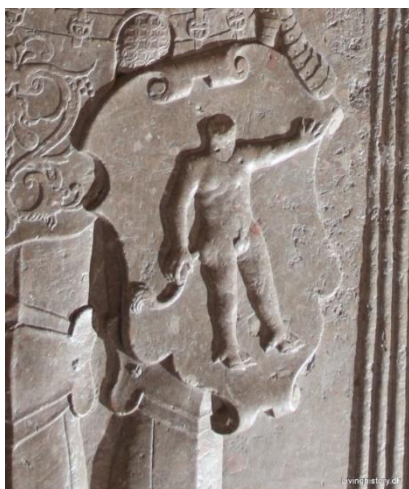
På Trolle/Gøje ligstenen i Herlufsholm kirke er trollden tydeligvis af hankøn.