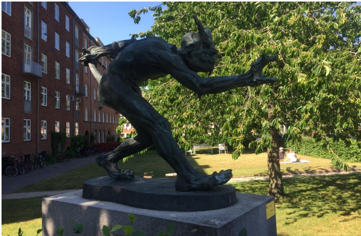
”Trolld, der vejrer kristenblod” udenfor Jesuskirke i Valby

kunne de godt lide at ligge ude og sole sig! De var snu og kunne godt lide at drille mennesker. Folk var bange for, at troldene skulle tage deres nyfødte børn, inden de blev døbt og lægge et troldebarn i stedet. Troldebørn var grimme og dumme, og spiste rigtig meget, uden at de voksede sig store. Disse forbyttede børn kaldtes skiftinger. Trollden var, i Danmark, nu næsten ved at være synonym med nissen.