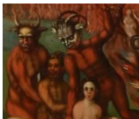
Trollden på Trollevåbenskjold, som de ses på diverse 1500-tals genstande, ligner datidens forestilling om djævelen, bare uden hoved. Børge Trolle, Herlufs storebror, blev endda omtalt som "Børge Dieffuel". I Næstved kan djævelen ses i al deres gru malet på to epitafier i Sct. Peders kirke. Det er et slankt, lettere behåret "kønsløst" væsen.