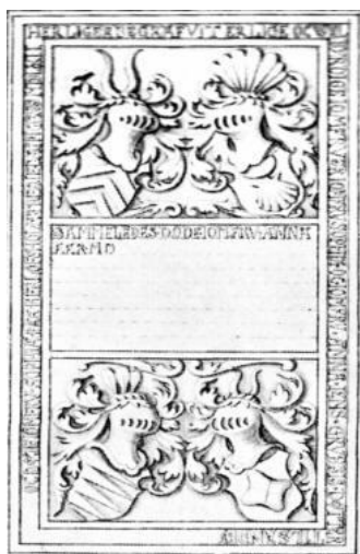
De fædrene våben Grubbe (Sparre) og Grubbe til venstre og Baden og Halvegge til højre.