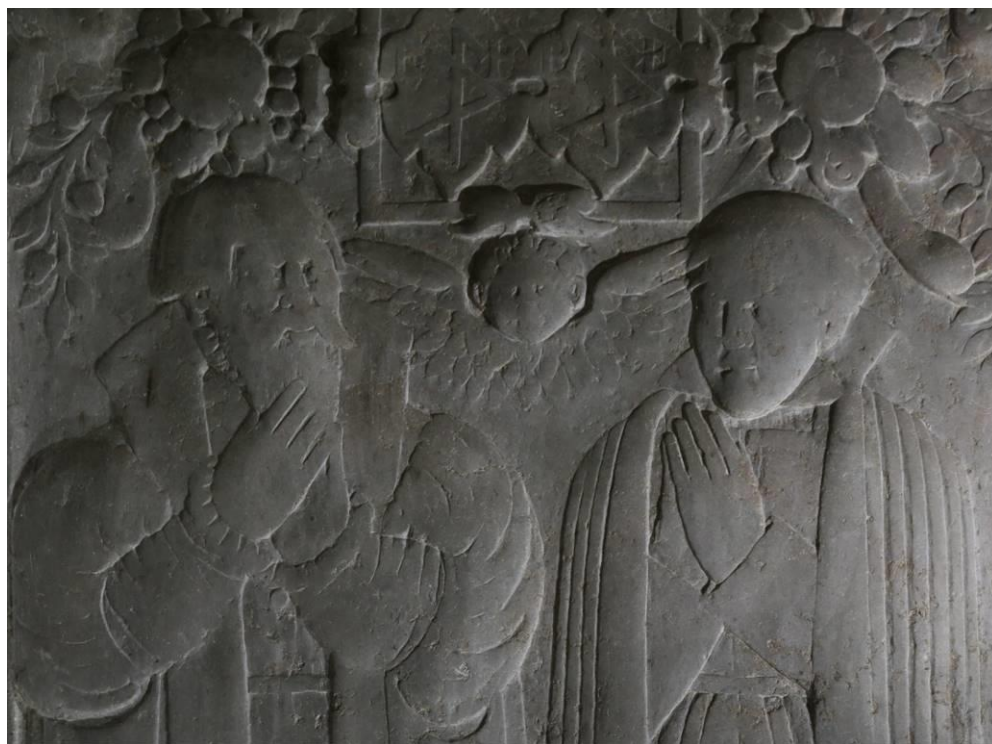
Pernille Gøje, Herlufsholm kirke