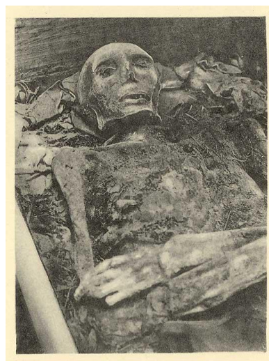
James Hepburn, Jarlen af Bothwell, Fårevejle kirke