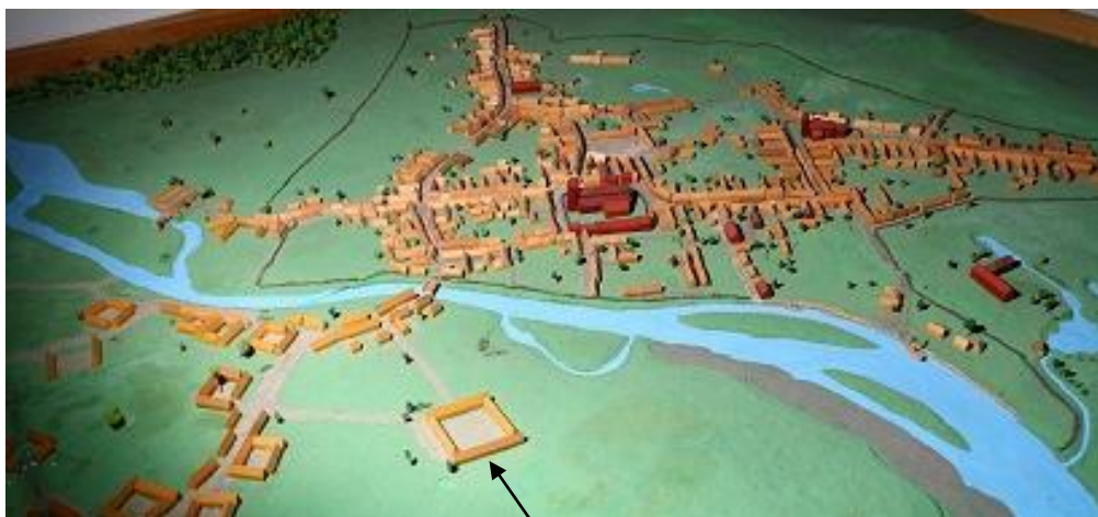
Den nye firelængede præstegård i Lille Næstved