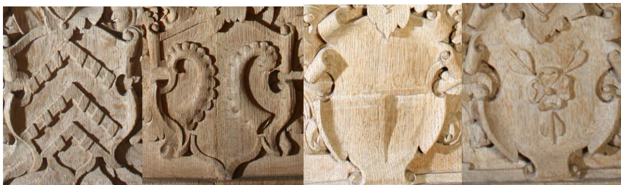
Sparre, Basse, Parsberg og Sehested våben på de meget flotte stolegavle i Toksværd kirke